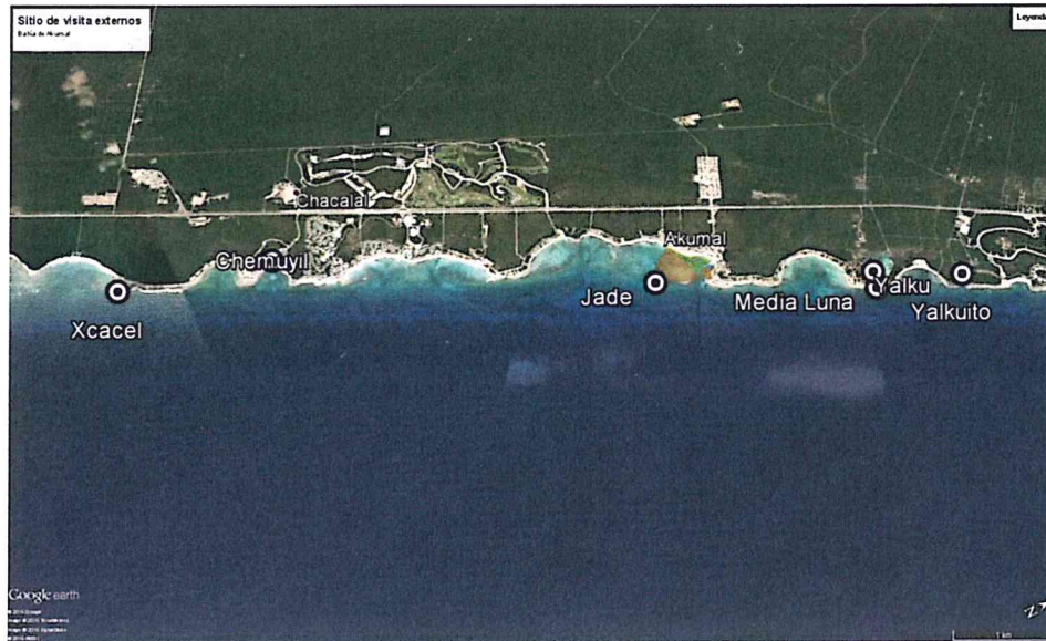
Fig. 3. Polígono del área de Refugio. Ubicación de sitios de vista externos.